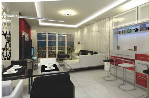
decoración 2 noche