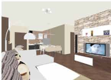
color sólido con texturas