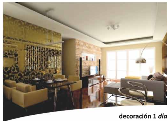
decoración 1 día