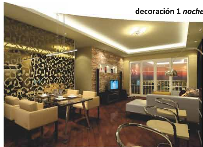
decoración 1 noche