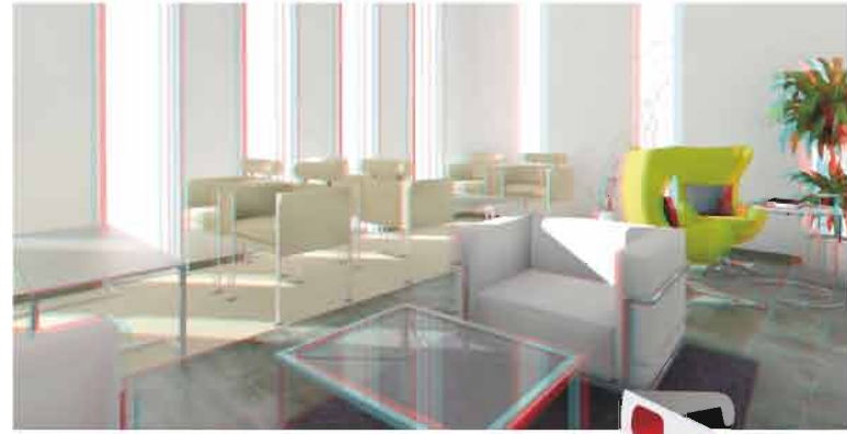
estereoscopia - gafas 3D