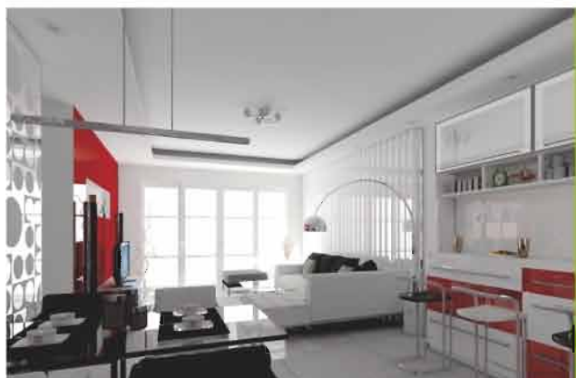
decoración 2 día