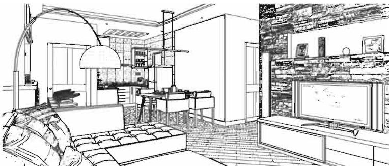
dibujo a mano