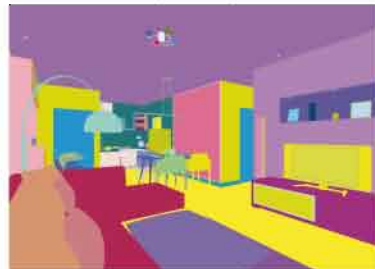
máscaras de selección