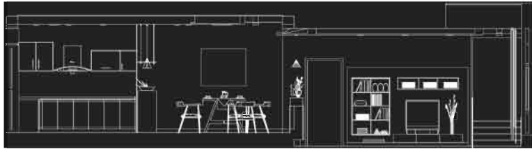
exporta planos a DXF