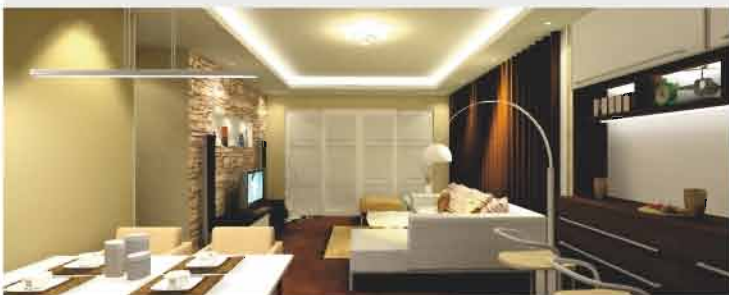
previsualización interactiva de iluminación